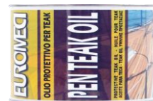
Latta da 375 ml.

Peso specifico / specific gravity / densité: 0,9 kg/l (+/- 0,1)