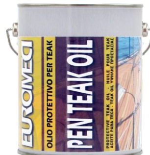
Latta da 4 Lt.