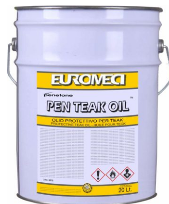
Latta da 20 Lt.